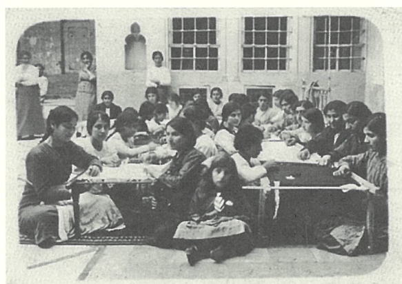
図2 難民女性の刺繍ワークショップ。シリア、ダマスカス、1919年。

現在のアルメニア共和国ではヴァンを中心とする地元由来のジャンヤックの他に先に述べたマラッシュとアインタップがみられる。一方、レバノンのベイルートのアルメニア人コミュニティでは、レバノンで受け継がれてきた各地域の刺繍を集め、「アルメニア刺繍」(Tokmajian, 2010)として刊行した 3) 。地域の特徴をもったアルメニアの刺繍を元の土地を離れた所で継承するには民族のアイデンティティをコレクティブ（集積）する必要があることをアルメニア人たちは強く感じている。