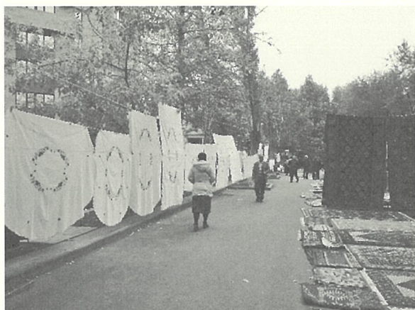
図1 ヴェルニサーチ市場の刺繍と絨毯の露店。 2011年4月。

ような名手もあり、作風や手技の違いを見て回る面白さがあった。刺繍はアルメニアの女性たちに受け継がれてきた伝統的染織技術であり、作り手が市場で販売することで家庭に現金収入を入れる手段でもある。刺繍について聞くと、「これはアインタップ」、「これはマラッシュ」、「これはヴァンのジャンヤック」と異なる様式の刺繍を指して教えてくれた。聞き取った単語を辞書で調べてみると地名であることが分かった。アインタップはトルコ南東の町のことで、刺繍の特徴は白地にドローワークという飾り窓をあけた刺繍技法、マラッシュもトルコの南東の町で、黒や赤のベルベット地に原色の糸で縄を編んだような十字が刺繍されていた。ヴァンはアルメニアの北の町で、ジャンヤックとは牙を意味して白糸を針でノッティングしたレースであることがわかった（トルコのオヤと同技法）。アルメニアの刺繍に関する英語文献がきわめて限られたなかで、フィールドワークを通じてようやく分かったことはアルメニア刺繍とひとことで言えるものは存在しないということである。アルメニアの刺繍は土地に由来した呼称をもち、「アルメニア刺繍」とは異なる意匠様式と技法の総称である。刺繍が土地の名前で呼ばれるには理由があり、それはアルメニアの歴史と深く結びついていた。刺繍は女性たちが自らのコミュニティの目印として、土地に根差した独自の刺繍様式を確立することで、他のコミュニティとの違いを糸と針で表現してきた。アルメニアはキリキア・アルメニア王国（1080または1198または1375年）として中世に領土を拡大したが、1636年にオスマン帝国とサファヴィー朝ペルシャに分割統治された。キリスト教を信仰するアルメニア人は対外的に