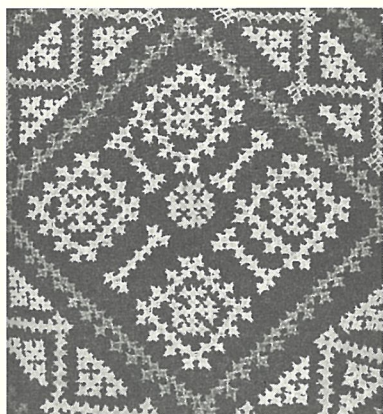
図4 インターレーシングステッチによるマラシュ刺繍。(Textile Revival at Crossroads, p.23より転載。)