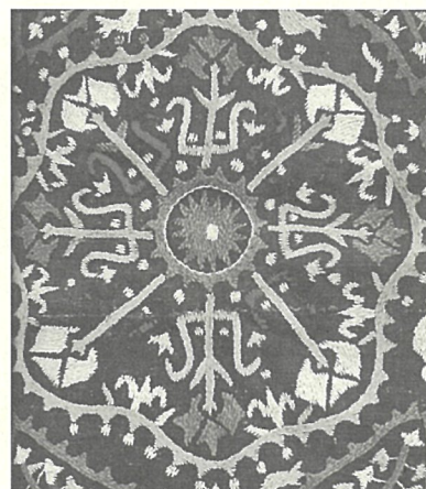
図3 フラット(サテン)ステッチによるマラシュ刺繍。19-20世紀。

インターレーシングステッチ (アルメニア語カグドゥナグ kaghdnag) は、基礎となる糸を十字に交差させたあとに、糸を交互に越して十字に巻きつけてゆく技法である。(図4、6) 十字を連続させる場合は、ヘリングボーンステッチを二重にし、線、円、三角、四角などが形づくれる。アルメニア伝統の石彫ハチュカル (khachqar) にも糸を交差させた文様が刻まれていることからハチュ刺繍とも呼ぶ。アルメニア人コミュニティが根を下ろした土地には同じ技法の刺繍がみられ、インドではハッチワーク